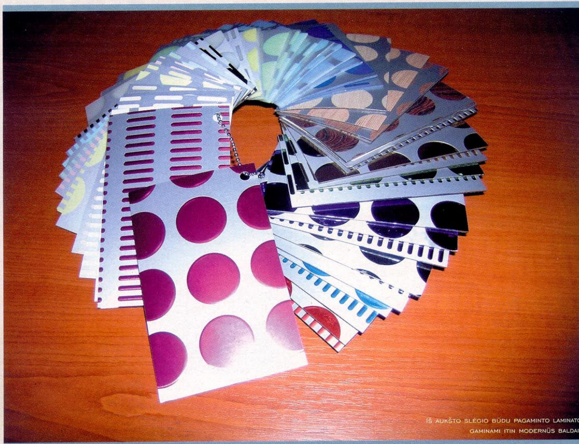
IŠ AUKŠTO SLĖGIO BŪDU PAGAMINTO LAMINATO GAMINAMI ITIN MODERNŪS BALDAI.