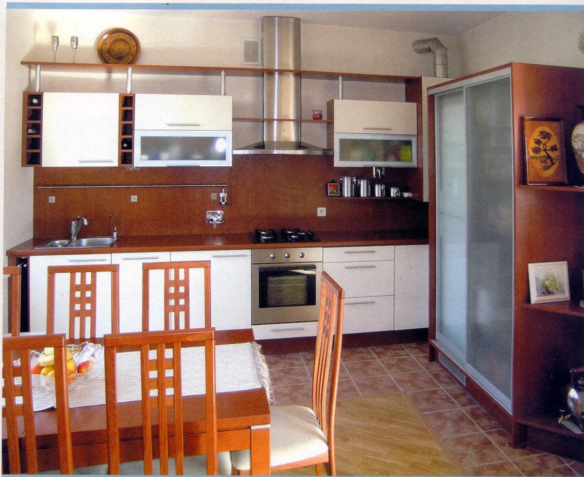
VIRTUVĖ – ŠIUOLAIKINIO BŪSTO ŠIRDIS.

lubomis (iki 5 m), taip pat baldus su įtaisomąja buitine technika (skalbiamosiomis mašinomis, elektrinėmis džiovyklomis). Vienetiniai baldai (iki 200 vnt. per mėn.) gaminami ne tik pagal architektų ar dizainerių projektus, bet ir pagal individualius užsakovo poreikius. Tokie gaminiai yra unikalūs, pasižymi išskirtine kokybe. Baldų kokybę, patogumą, išvaizdą ir ilgą tarnavimo laiką lemia juos gaminant naudojamos žaliavos, dizaino sprendimai, atskirų detalių surinkimo darbų kokybė. UAB „Baldų sistemos“ gaminiai tarnauja 8–10 metų.