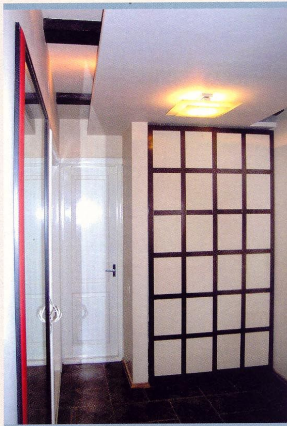
JAPONIŠKO STILIAUS SPINTA SU STUMDOMOSIOMIS DURIMIS.

ginalų interjerą ir įgyvendinti įvairiausias architektų bei dizainerių idėjas.