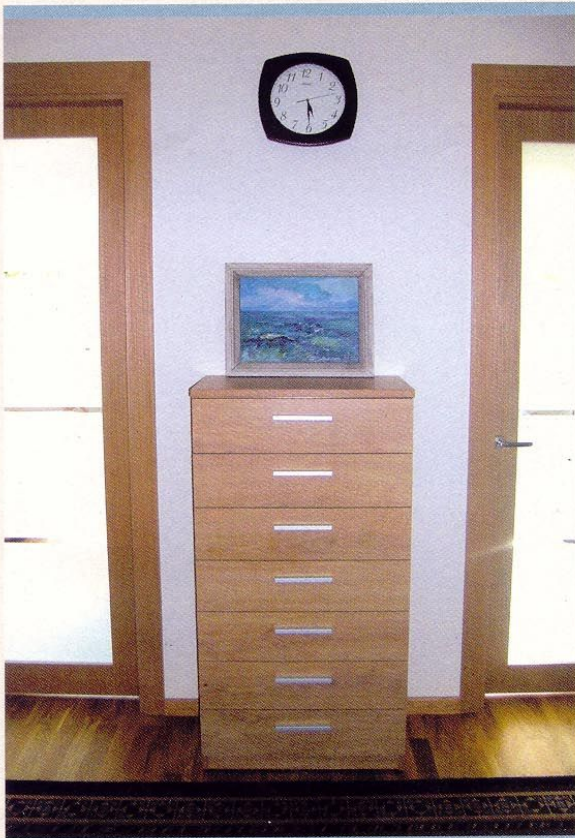
PRIEŠKAMBARIO KOMODA SKONINGAI ĮKOMONUOTA TARP DVEJŲ DURŲ.